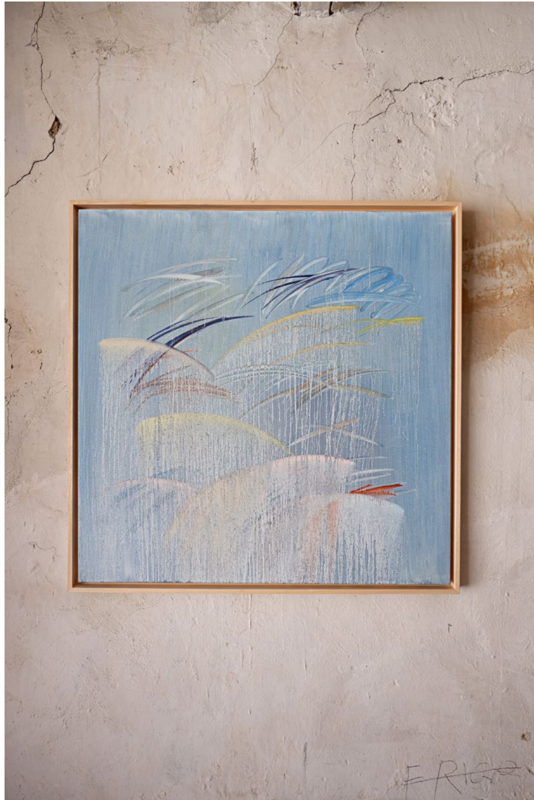
1.2 Tableau affresco, MEZZOGIORNO Peinture à l'huile sur toile Encadrement caisse américaine 80 x 80 cm 2021