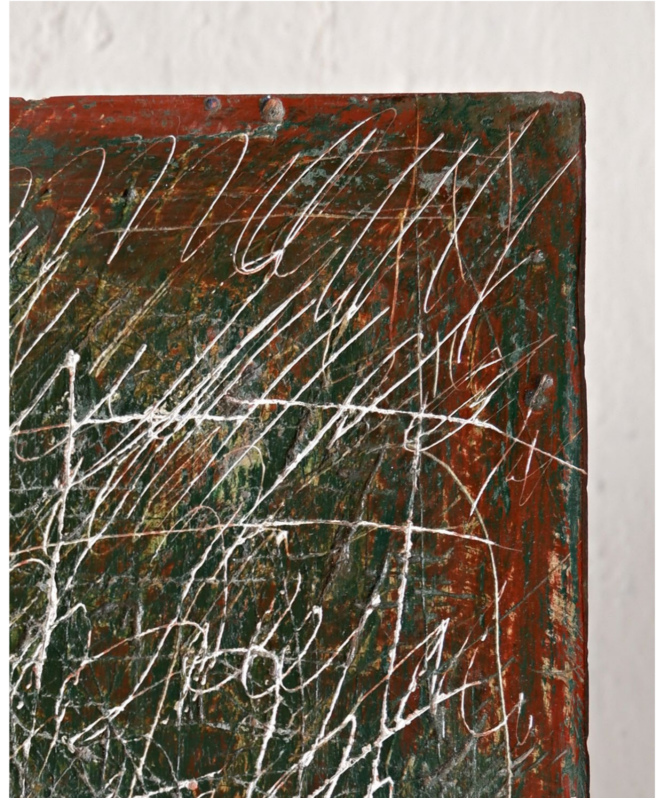
détail frammento n°10