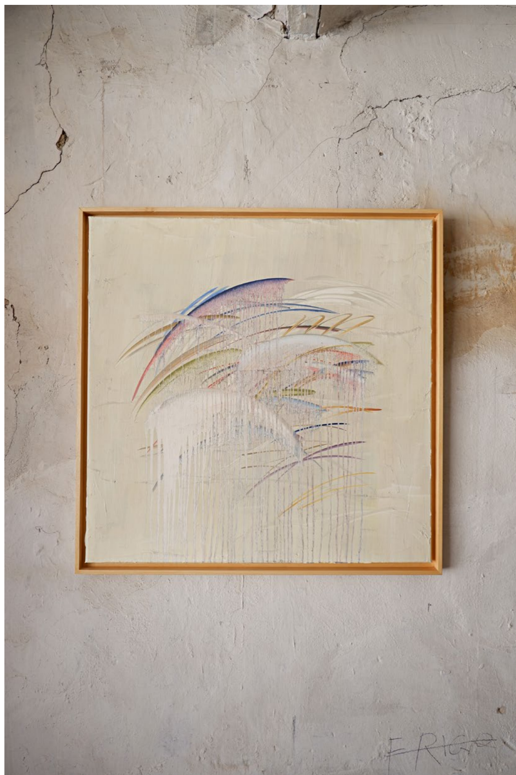
1.4 Tableau affresco, VENTI Peinture à l'huile sur toile Encadrement caisse américaine 80 x 80 cm 2021