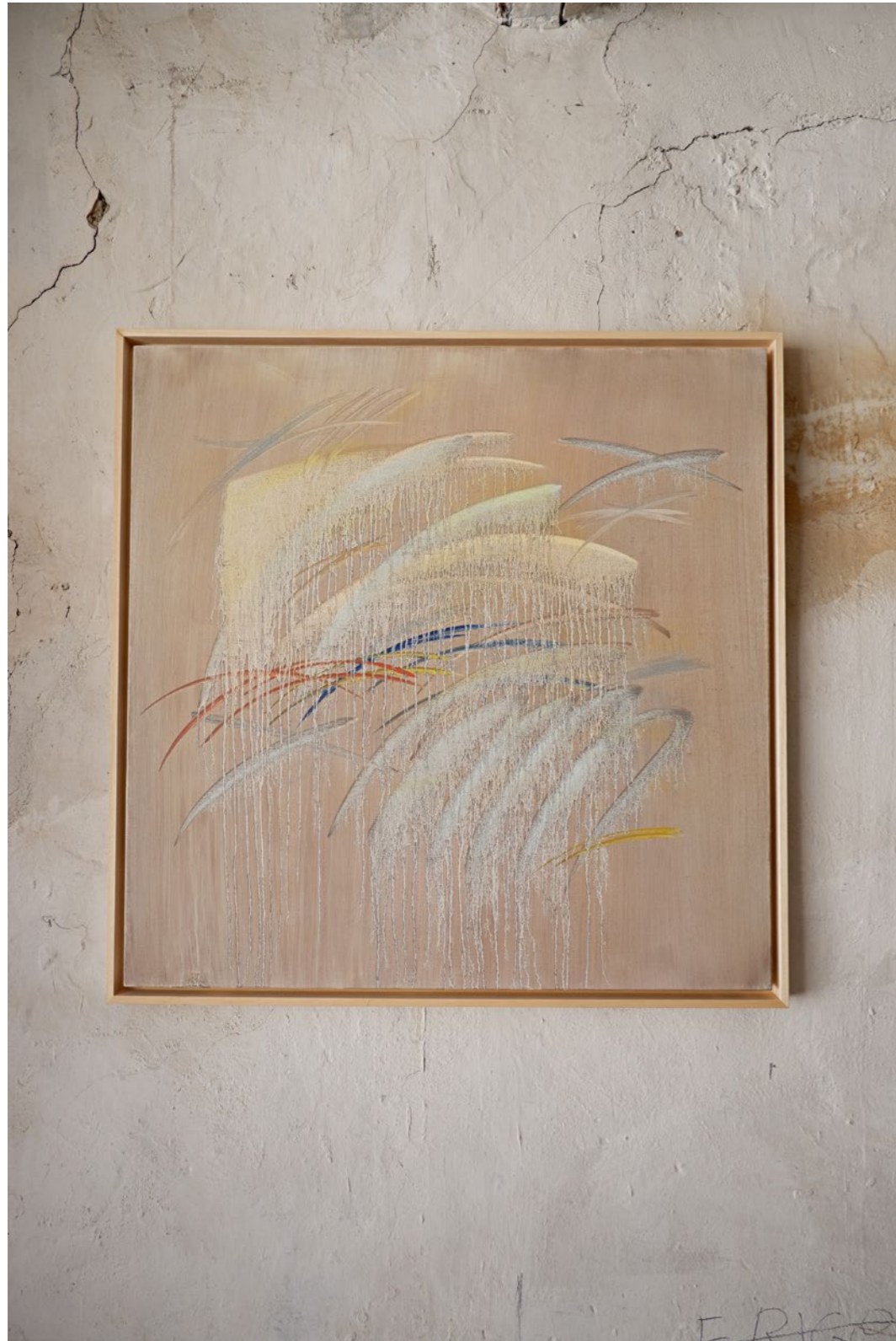
1.3 Tableau affresco, SERA Peinture à l'huile sur toile Encadrement caisse américaine 80 x 80 cm 2021