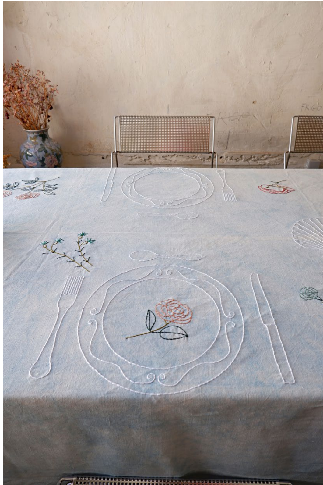
3.1 Nappe BOTTICELLI Broderie sur teinture indigo et tissu ancien en lin et coton 260 x 150 cm 2021