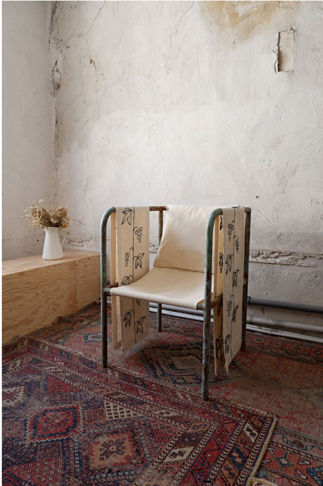
4.1 Fauteuil BACCHUS Tube acier cuivré et oxydé Broderie sur tissu ancien 2021