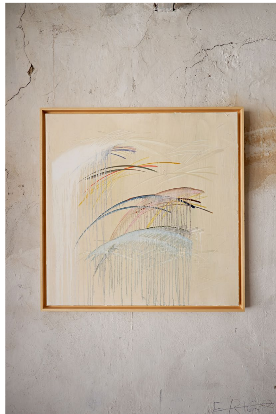
1.5 Tableau affresco, FULMINE Peinture à l'huile sur toile Encadrement caisse américaine 80 x 80 cm 2021