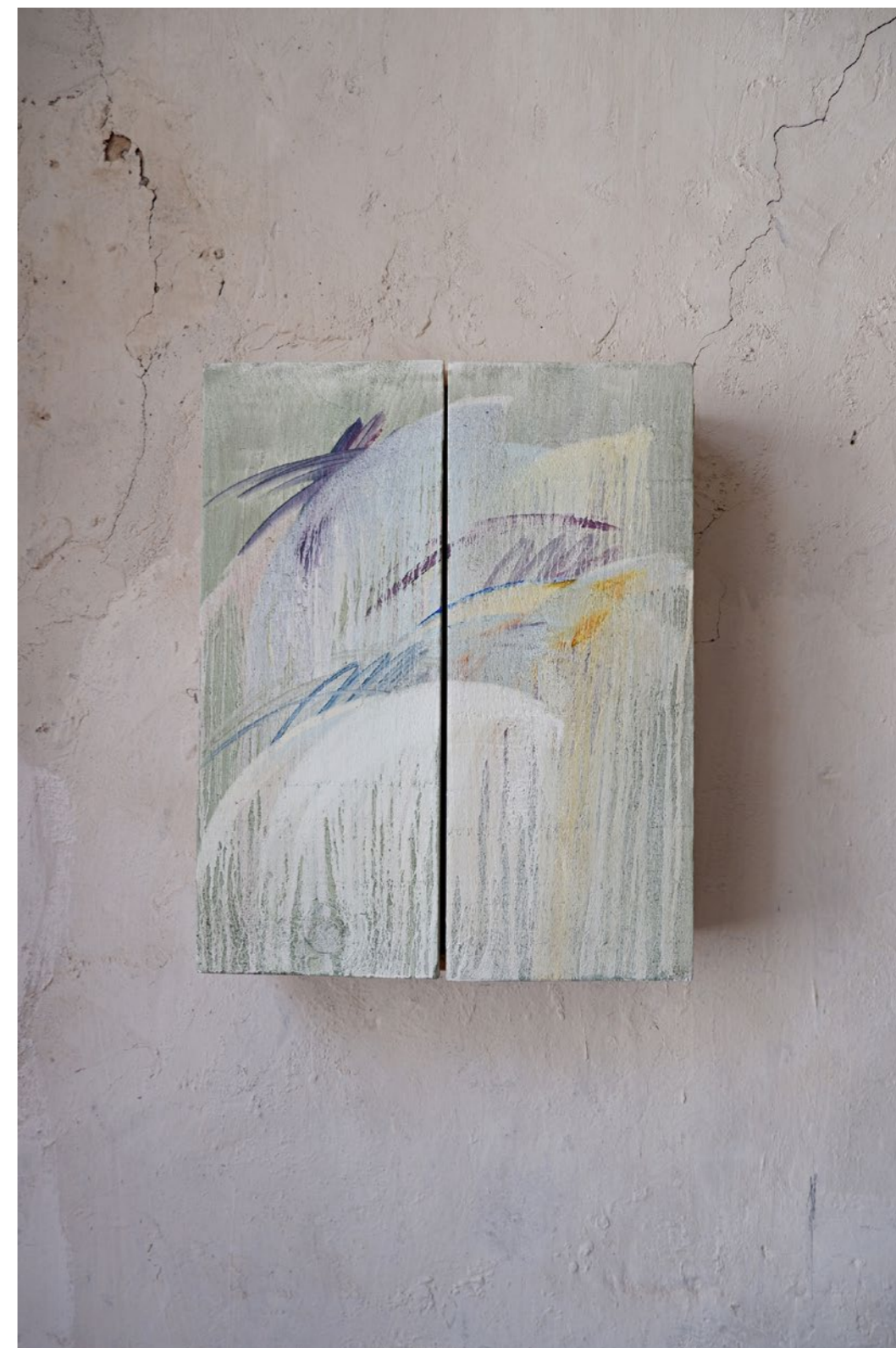
4.4 Tableau placard mural ARMADIETTO Peinture à l'huile sur bois 50 x 40 x 13 cm 2021