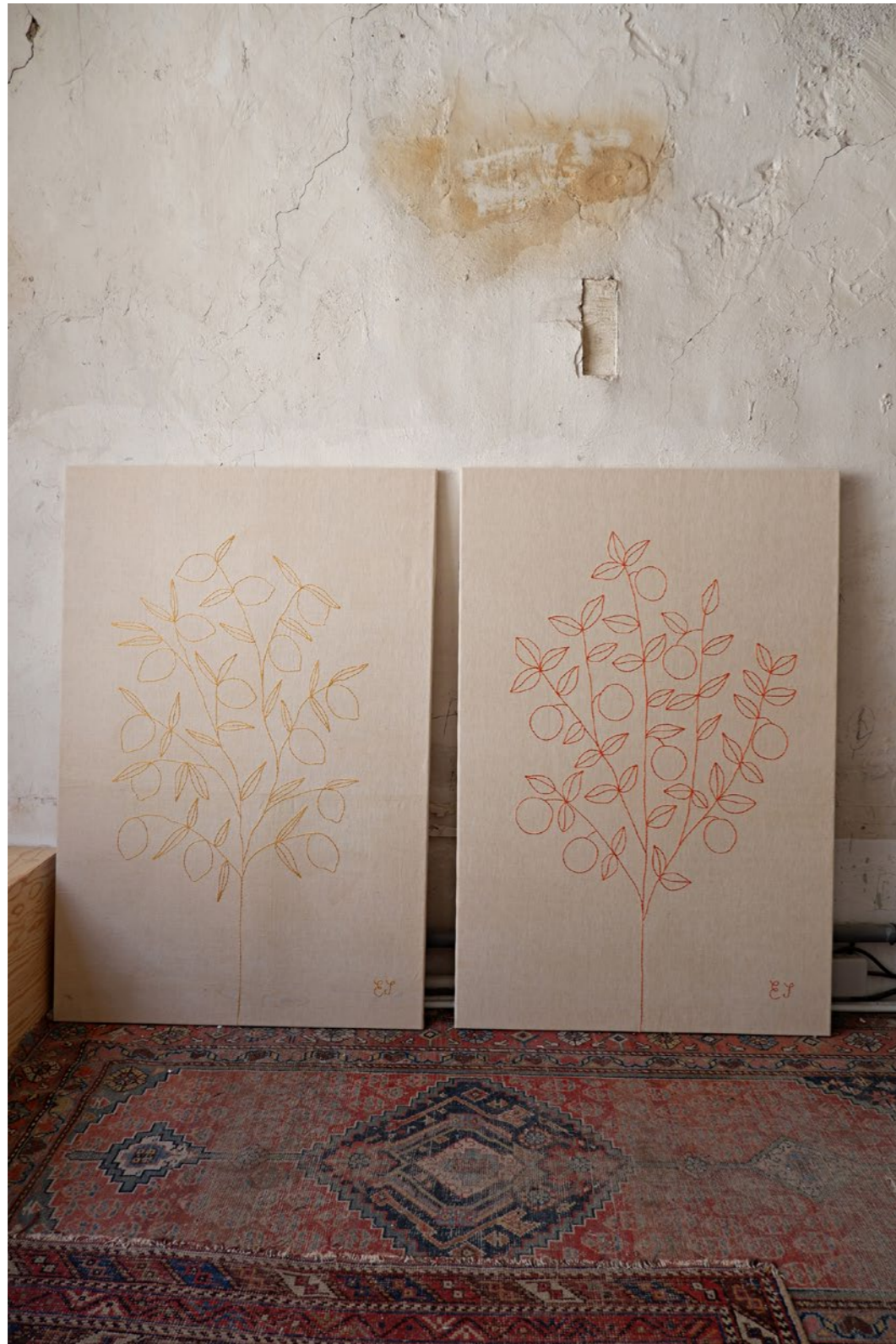
3.2 Tapisseries LIMONI & ORANCIO Toiles enchâssées Broderie sur tissu ancien en lin 120 x 80 cm chacune 2021