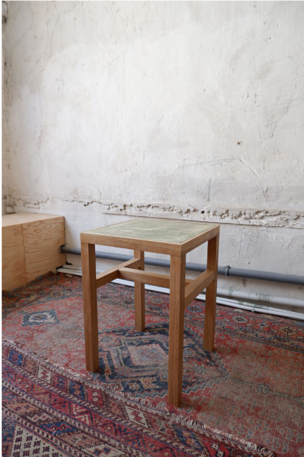
4.2 Tabouret GRAFFITO MOBILI Bois et peinture tempera sur plâtre 43 x 32 x 32 cm 2021