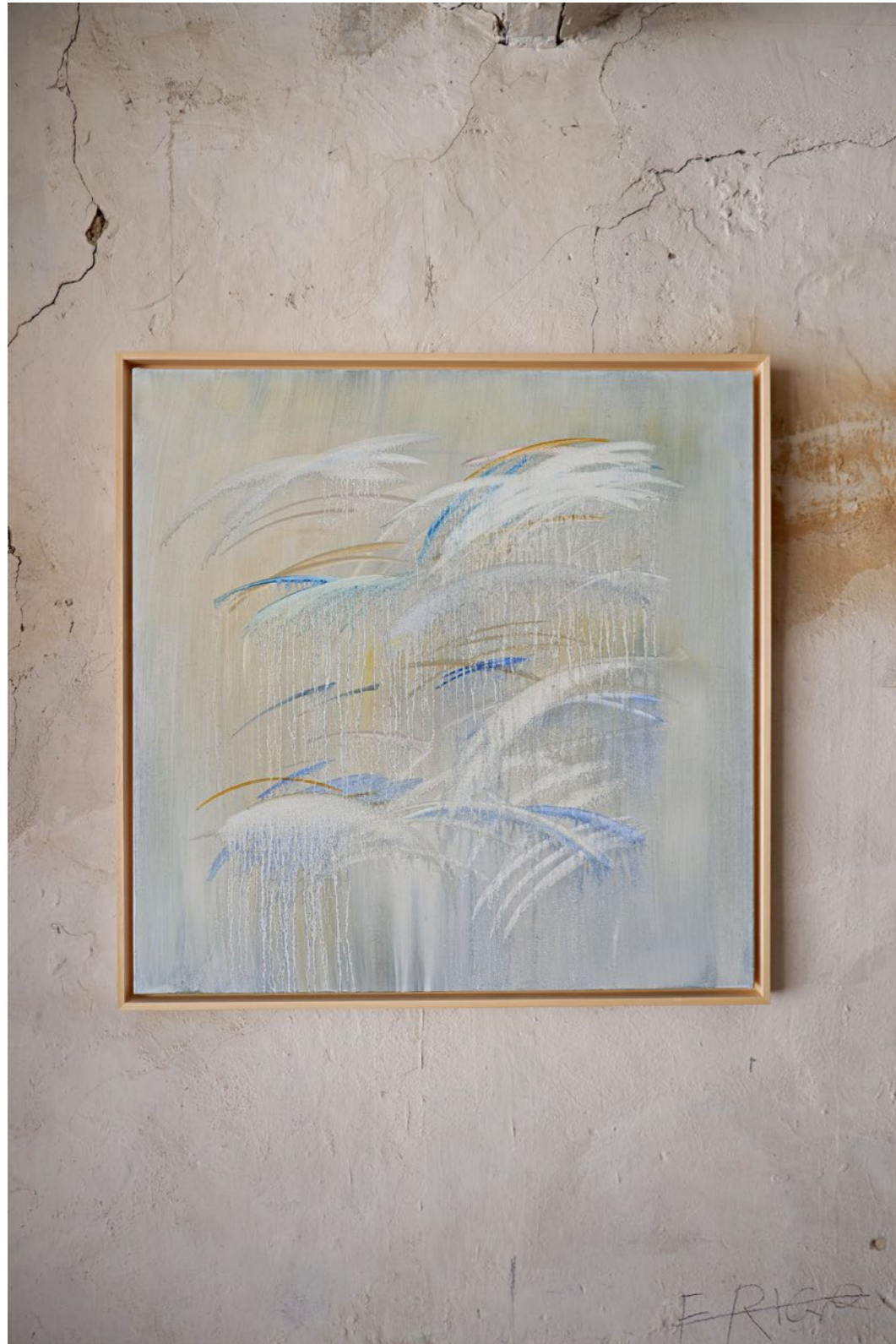
1.1 Tableau affresco, MATTINA Peinture à l'huile sur toile Encadrement caisse américaine 80 x 80 cm 2021