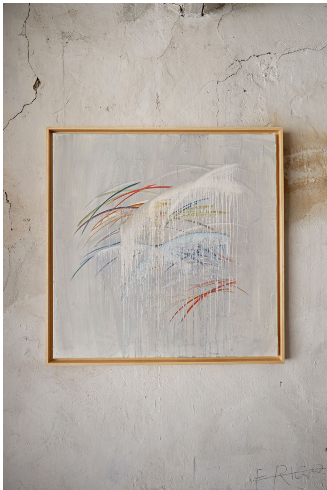
1.6 Tableau affresco, NEBBIE Peinture à l'huile sur toile Encadrement caisse américaine 80 x 80 cm 2021