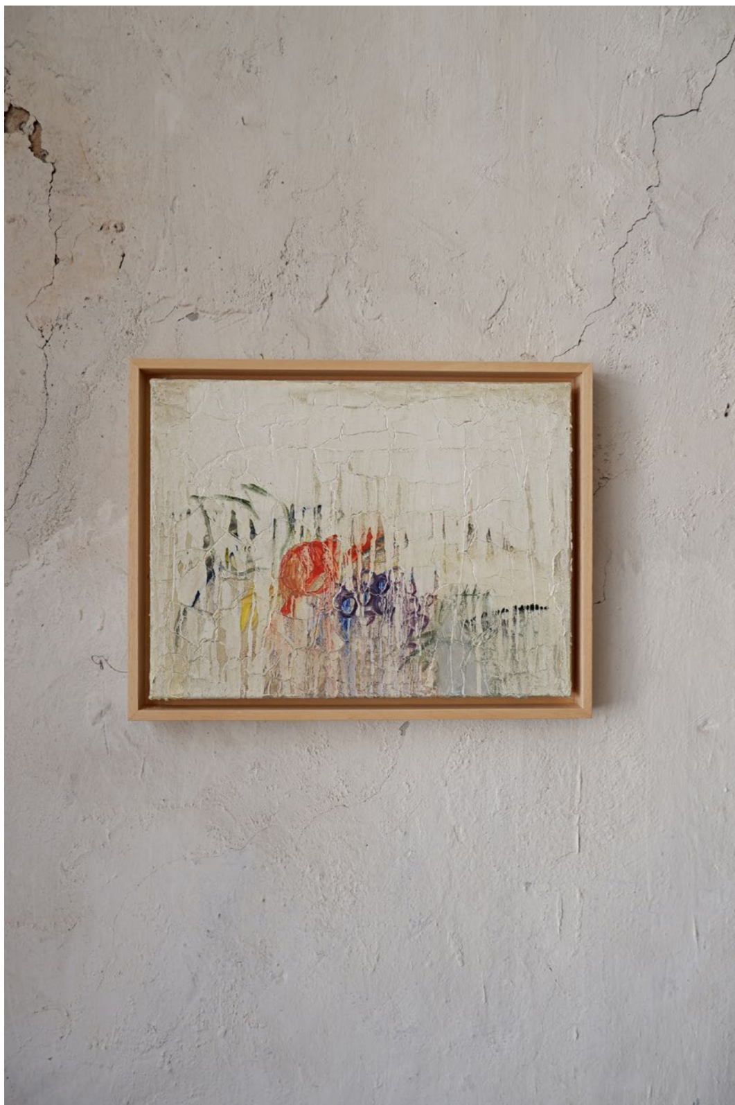
4.3 Tableau PINACOTECA-AMBROSIANA Peinture à l'huile sur toile Encadrement caisse américaine bois 40 x 30 cm 2021